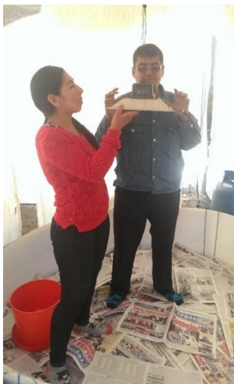
Figura 6. Colocación de la campana calefactora