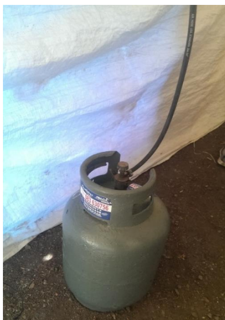
Figura 7. Instalación del balón de gas