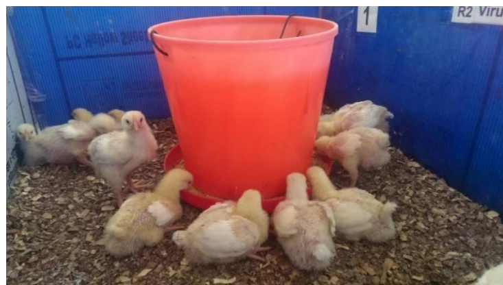
Figura 15. Vigilando su crecimiento constante