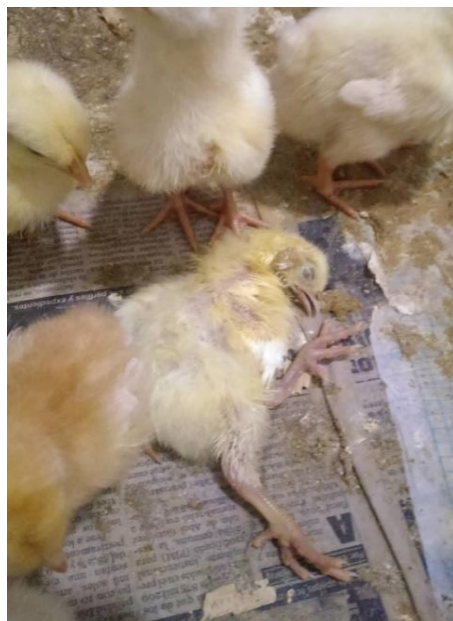
Figura 16. Mortalidad por aplastamiento