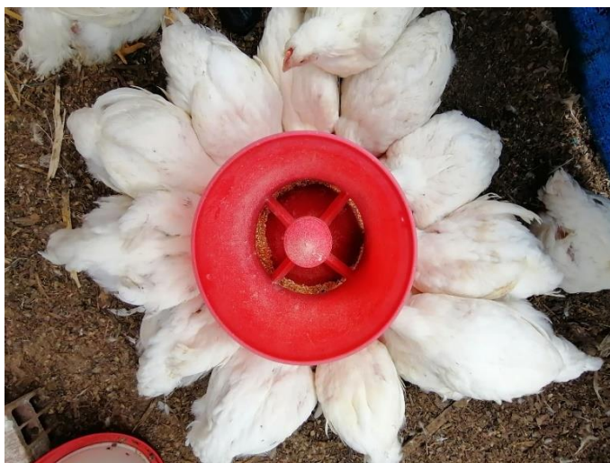
Figura 18. Momentos de su alimentación