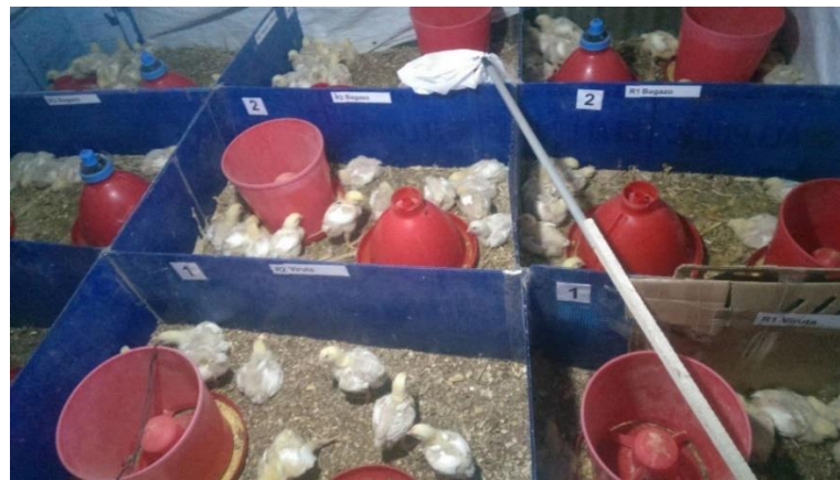
Figura 14. Ubicación de los cubículos de los pollos