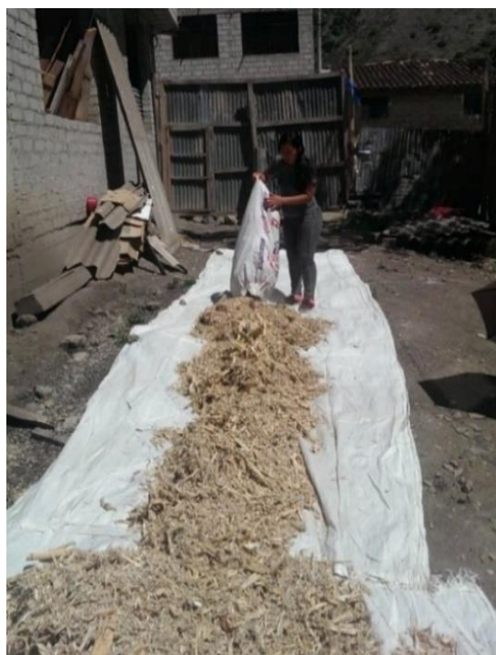
Figura 3. Secado al sol y fumigado