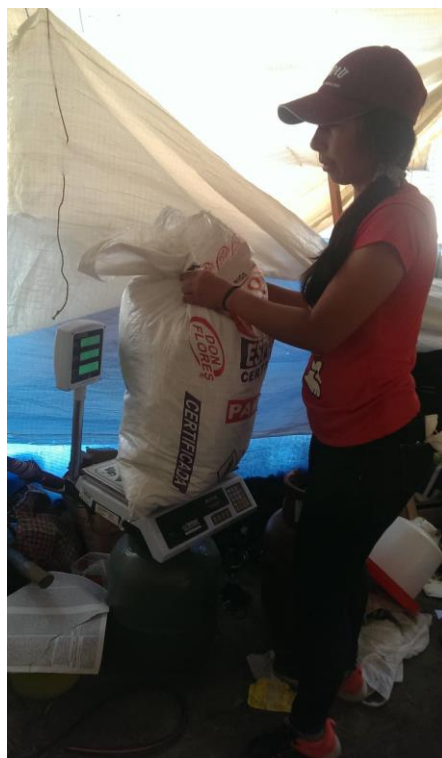
Figura 8. Pesado de los materiales de cama