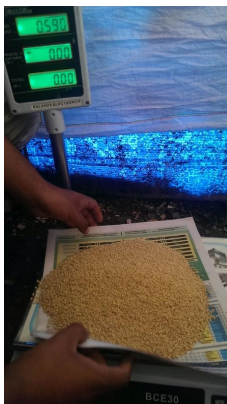
Figura 11. Pesado del alimento antes de su repartición