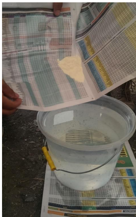
Figura 10. Dosificación de vitaminas en el agua.