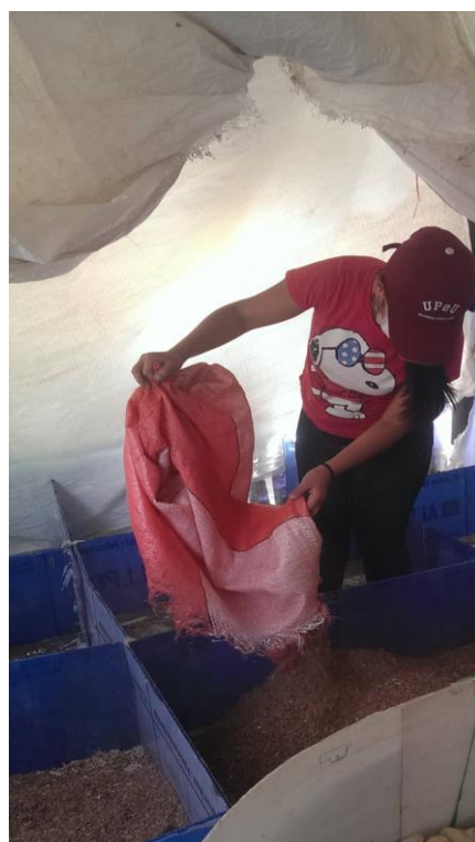
Figura 9. Distribución del material de cama.