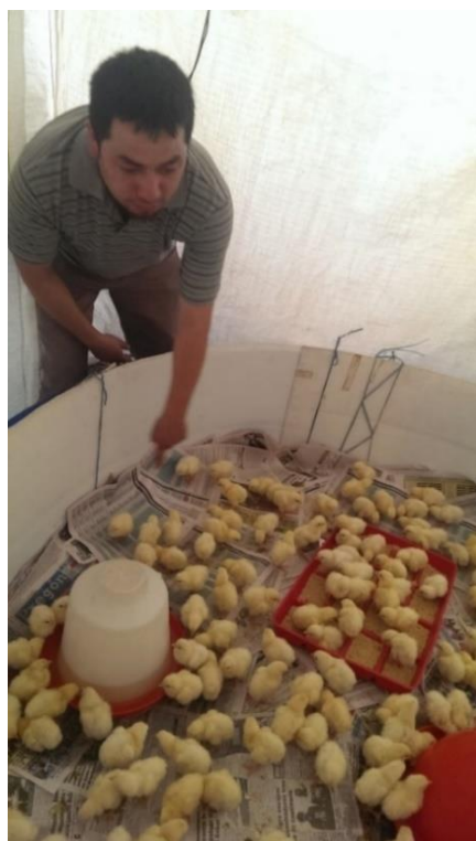
Figura 13. Evaluación de los pollitos a su llegada