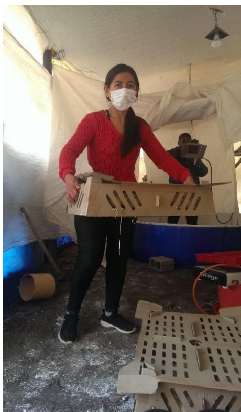
Figura 12. Recepción de los pollitos