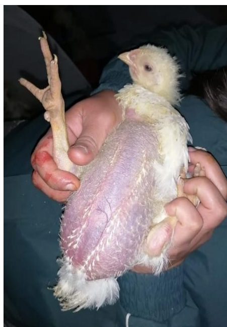
Figura 17. Mortalidad por casos de ascitis.