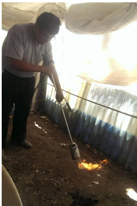
Figura 4. Desinfección con lanza llamas