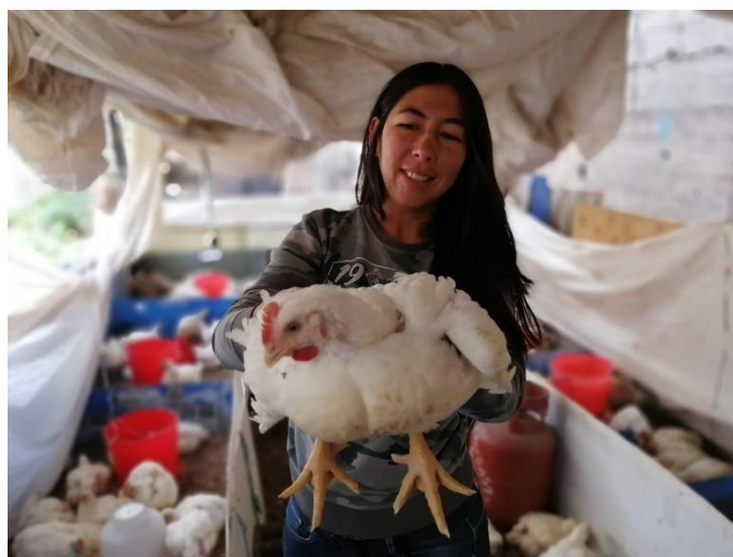
Figura 19. Pollo al final de la campaña