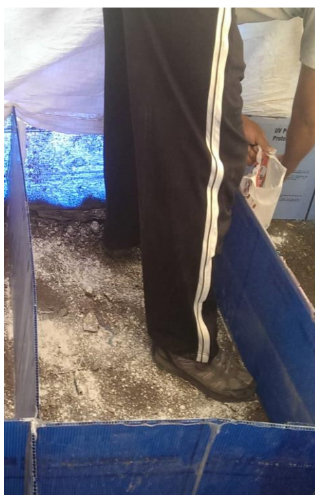
Figura 5. Desinfección con cal.