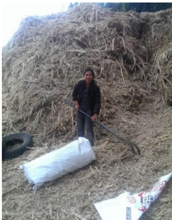
Figura 2. Almacenamiento del bagazo de caña