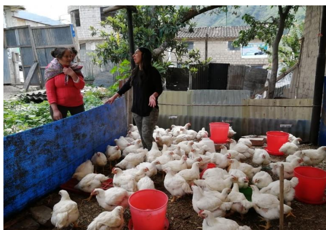
Figura 20. Sexta semana, etapa final