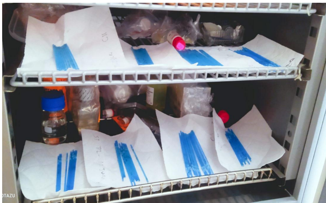
Figura 7. Estabilización de pajillas con semen después de su cargado