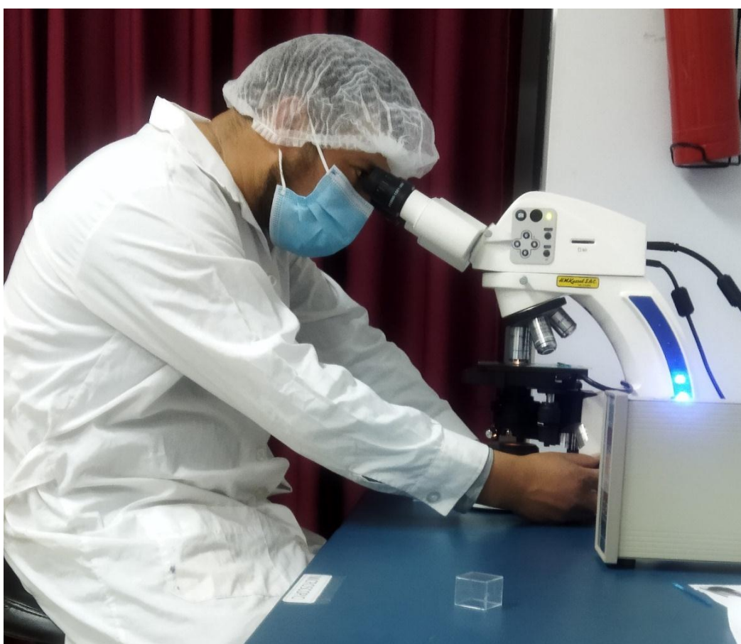
Figura 4 Evaluación espermática post colección del semen