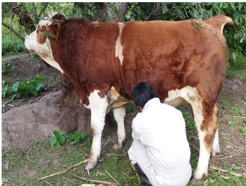
Figura 2. Preparación del semental de raza Fleshviek para la colección del semen