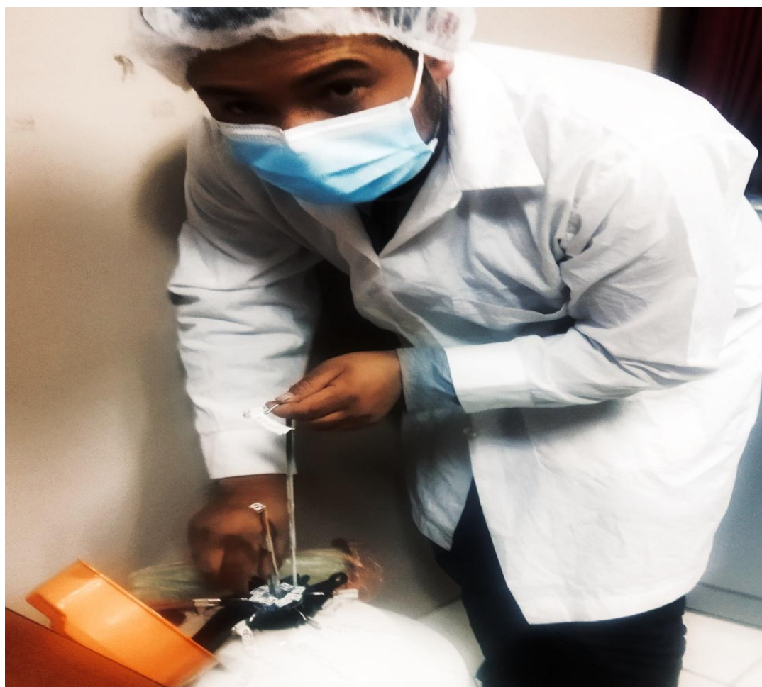
Figura 10. Almacenamiento de pajillas en tanque criogénico.