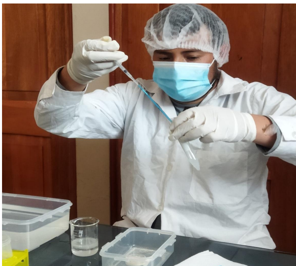
Figura 6. Cargado de pajillas con semen diluido