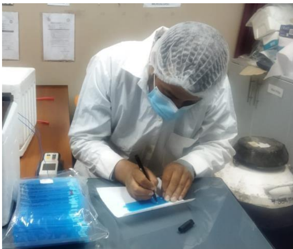
Figura 5. Identificación de pajillas para empajillar el semen