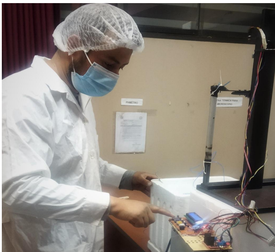
Figura 8 Programación de las diferentes curvas de congelamiento