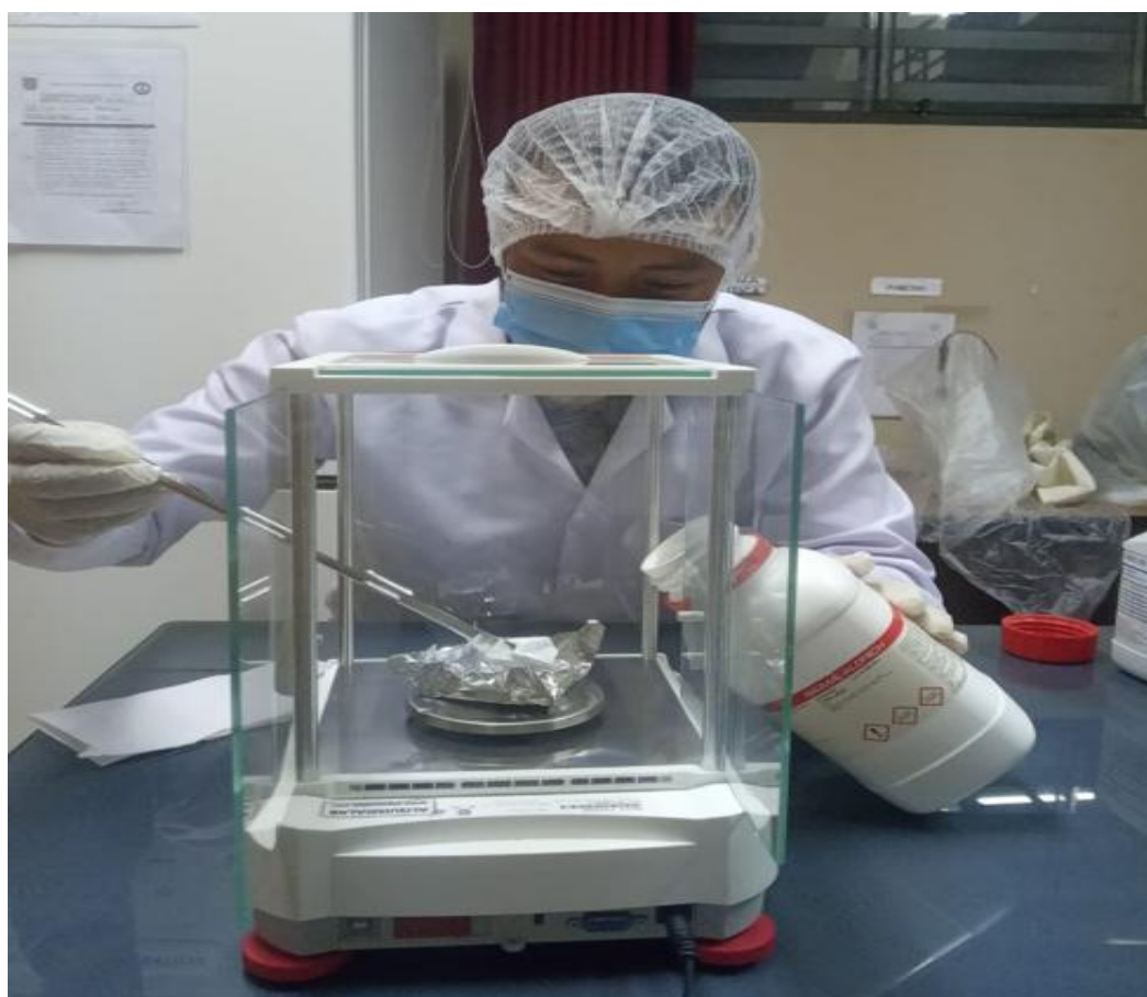
Figura 1. Preparación de dilutor tris yema de huevo