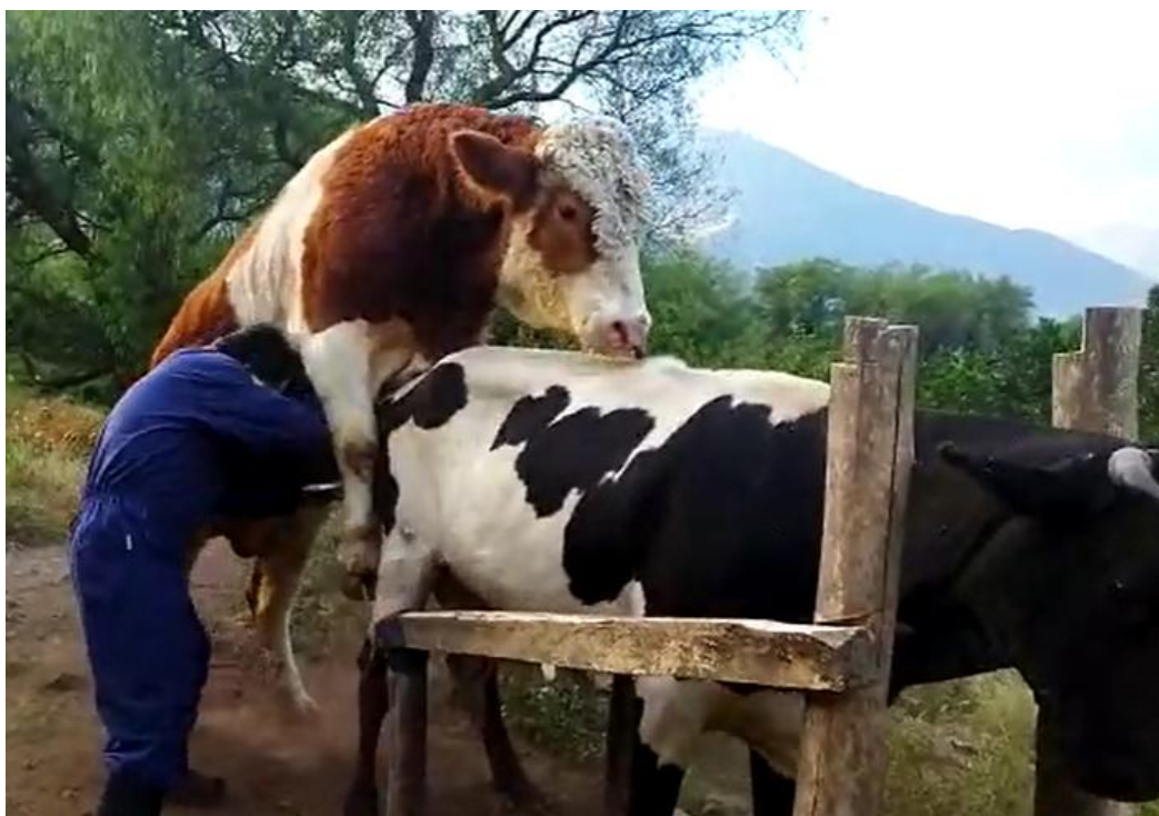
Figura 3. Colección de semen mediante vagina artificial