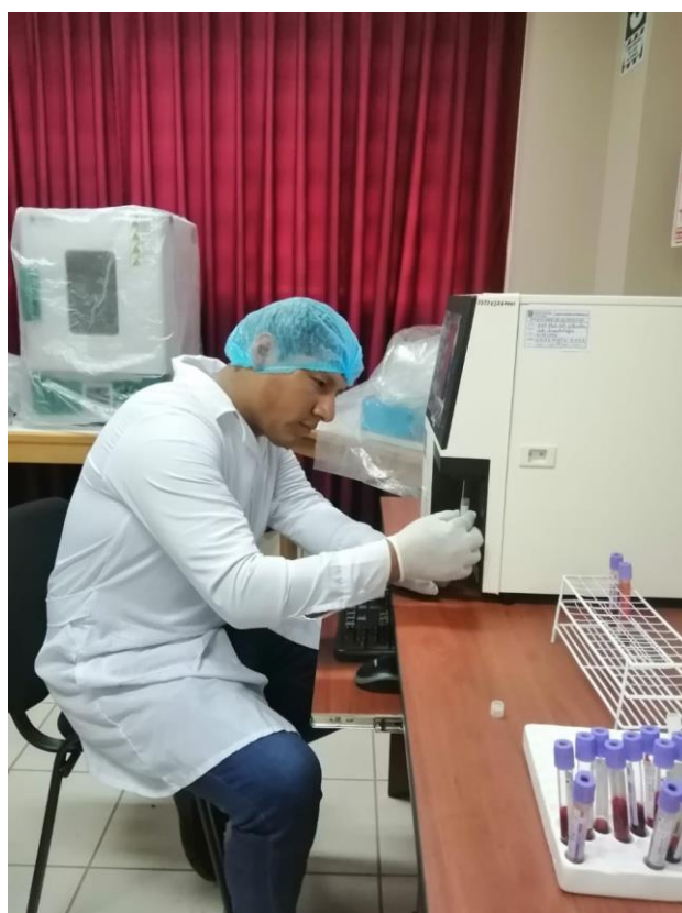
Figura 8. Homogenizando la muestra antes de someter al análisis.