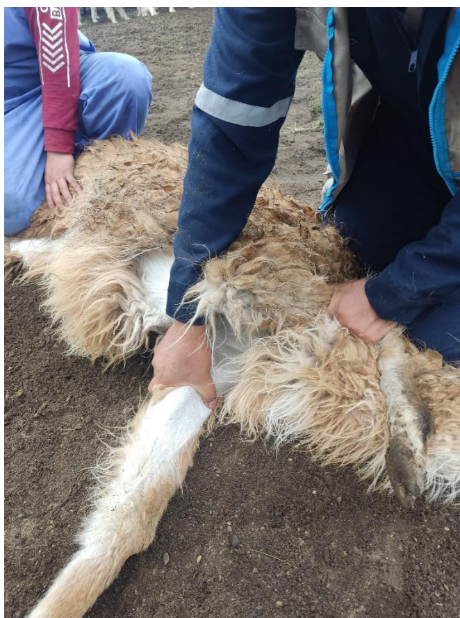
Figura 3. Proceso de hemostasia.