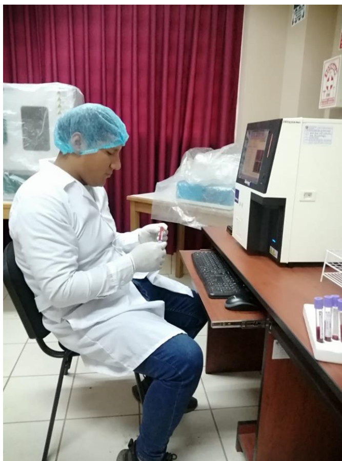
Figura 9. Iniciando con el análisis de las muestras.