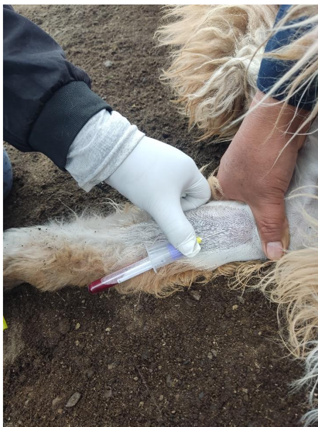
Figura 5. Inserción del tubo al vacío con EDTA.