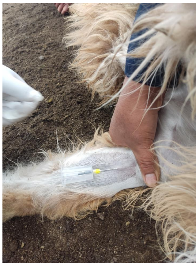
Figura 4. Inserción de la aguja de doble punta en la vena cefálica.