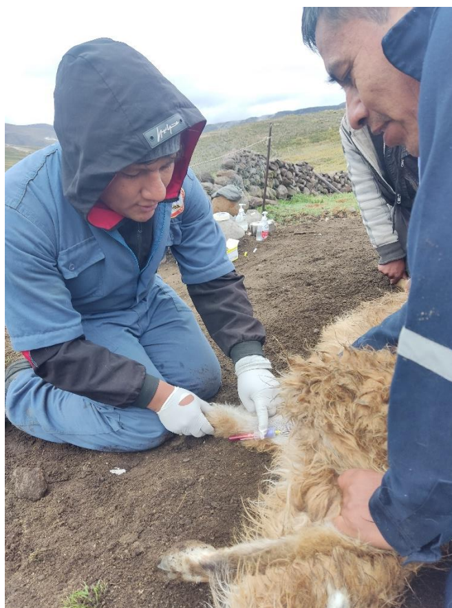
Figura 6. Concluyendo la toma de muestra.