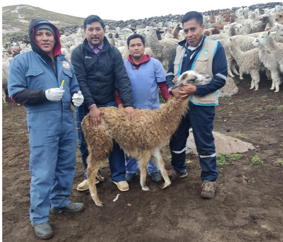
Figura 1. Selección de crías de llamas.