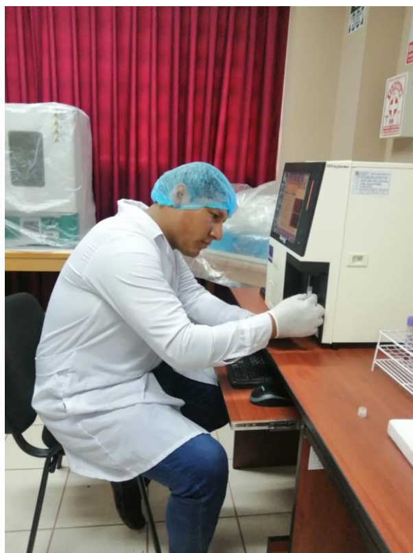
Figura 7. Selección de muestras para iniciar la lectura.