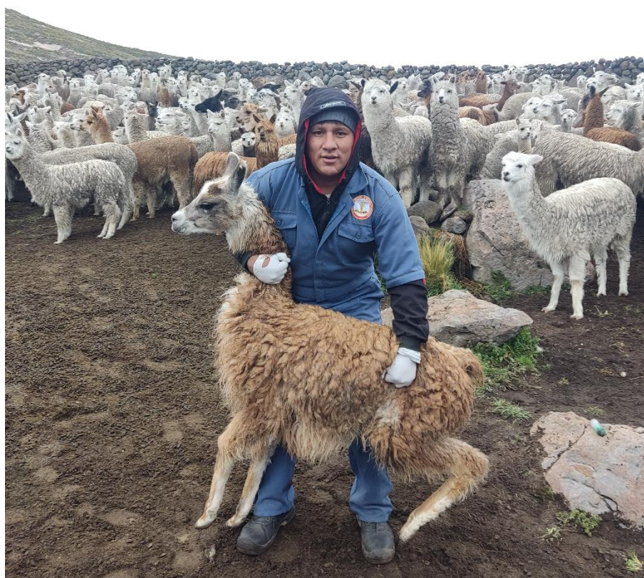
Figura 2. Sujeción de la cría para muestreo de sangre.