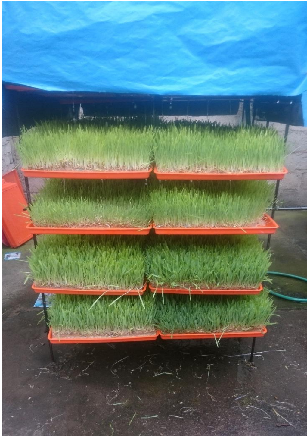
Figura 9. Variedades de cebada depositadas en el área de producción durante 4 días