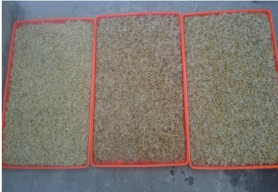
Figura 7. Enraizado de semillas de cebada