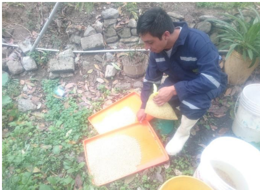
Figura 3. Peso, selección y limpieza de semillas