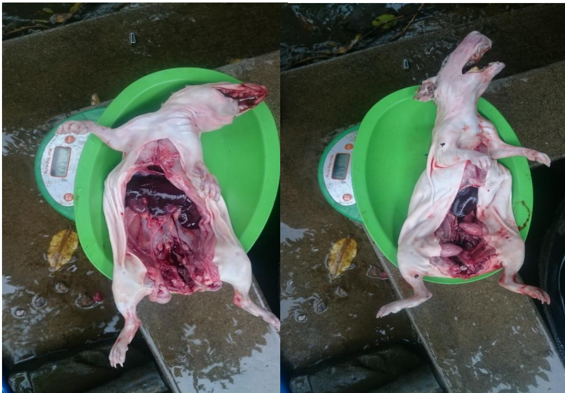
Figura 14. Peso de carcasa (cabeza, corazón, pulmón, hígado y riñon