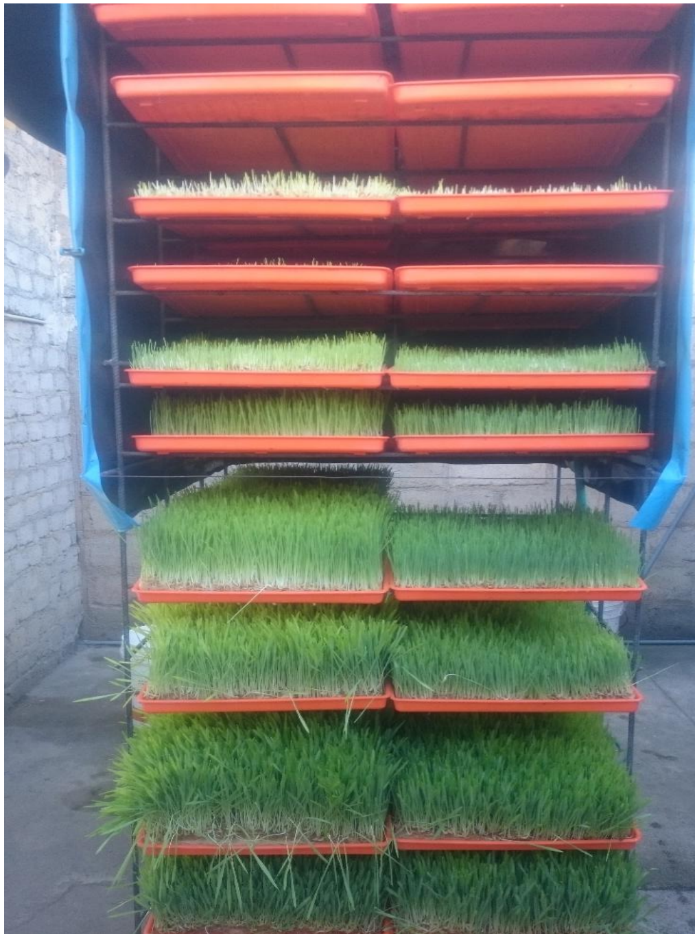
Figura 10. Módulo de producción y germinación de forraje verde hidropónico