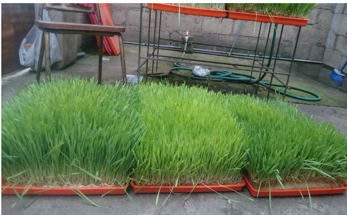
Figura 11. Oreo de forraje verde hidropónico (tres variedades de cebada)