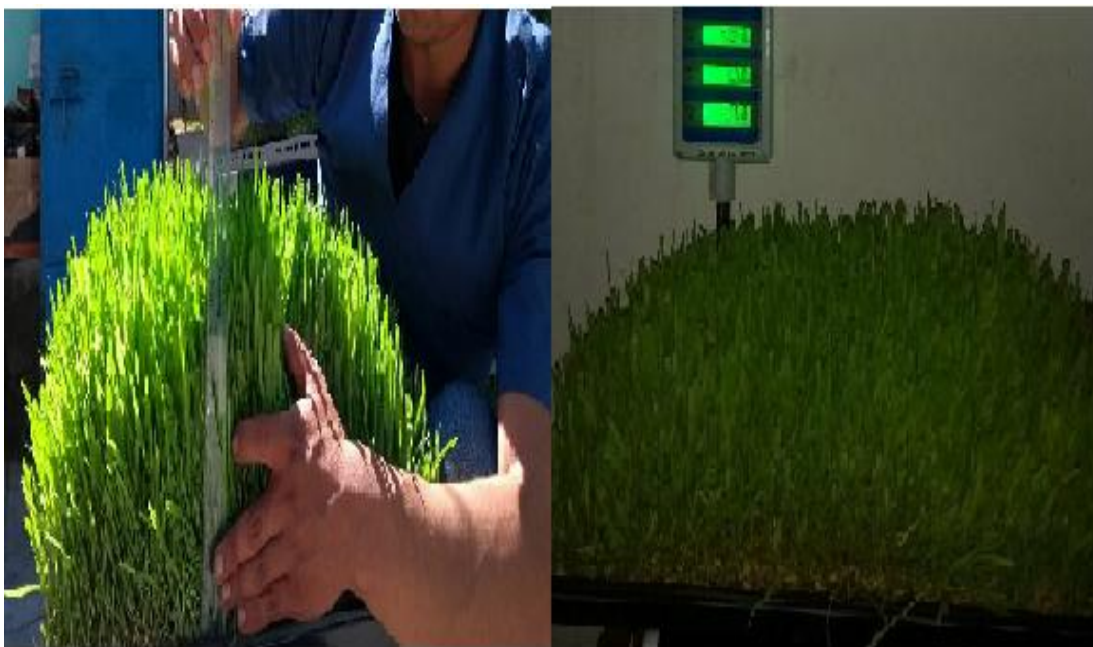
Figura 12. Altitud (cm) y peso (g) de FVH (3 variedades de cebada)