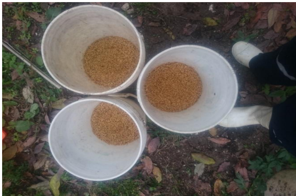
Figura 5. Remojo (24 horas) y oreo de semillas