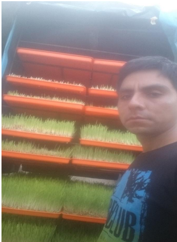
Figura 8. Variedades de cebada depositadas en el área de germinación durante 6 días