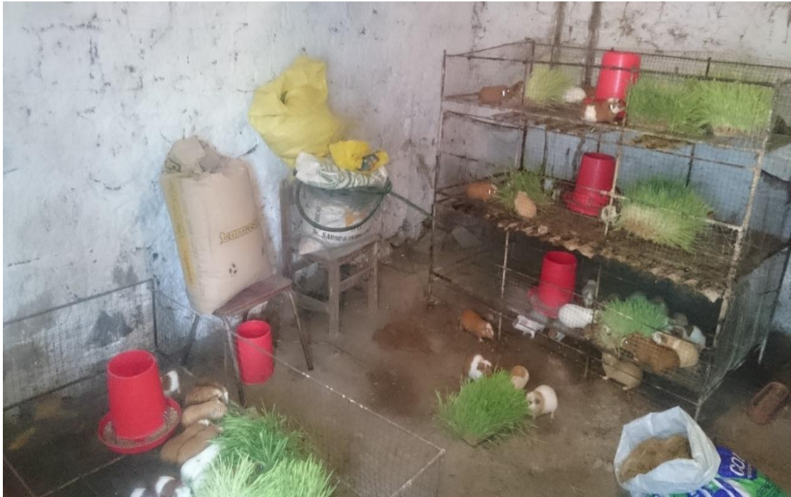
Figura 13. Alimentación de cuyes con forraje verde hidropónico y concentrado comercial