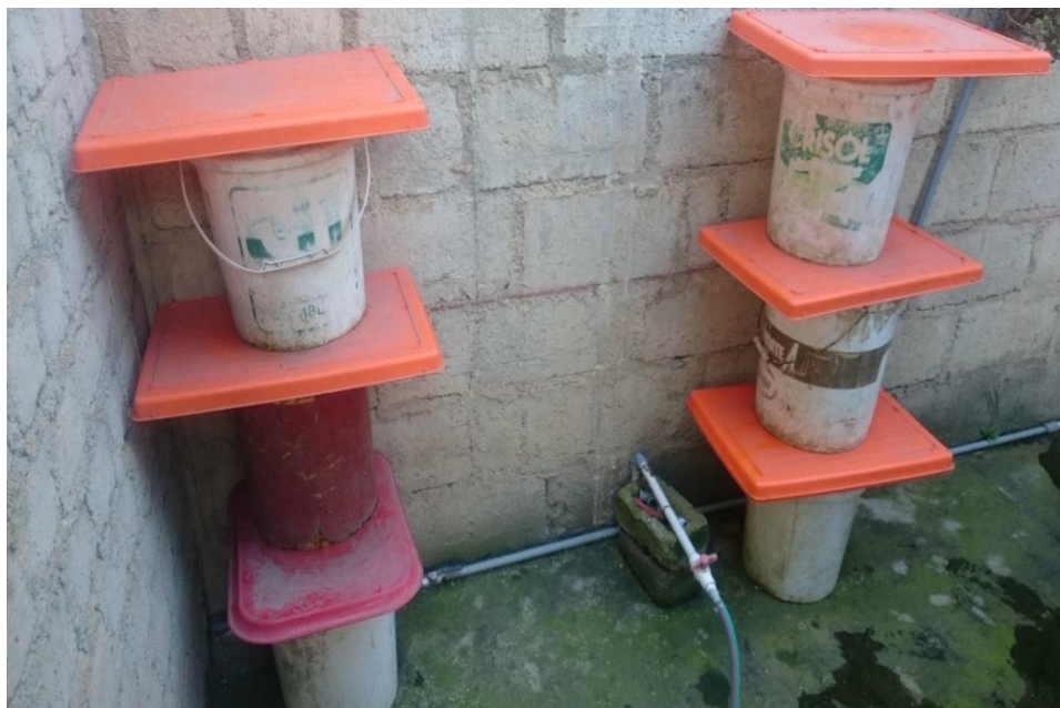
Figura 6. Germinación de semillas durante 48 horas