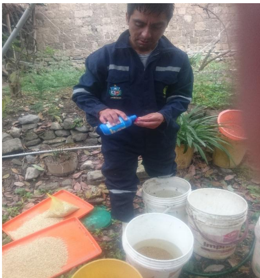
Figura 4. Lavado y desinfección de semillas de cebada con hipoclorito de sodio al 1%