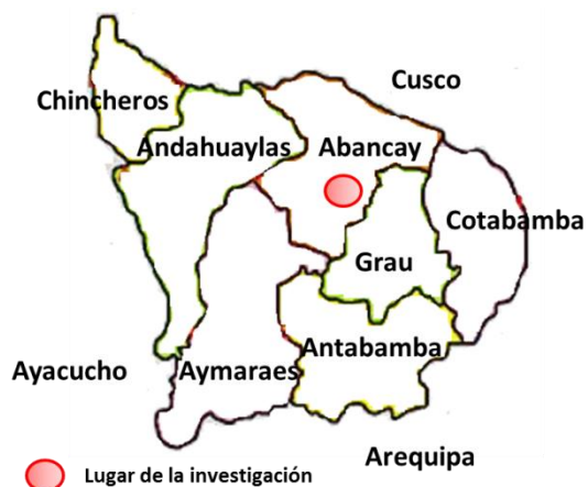
Figura 1. Lugar de la experimentación