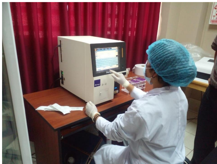
Fig. 8. Lectura de muestras