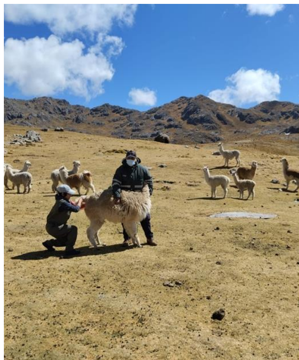
Fig. 2. Diagnóstico de preñez en alpacas