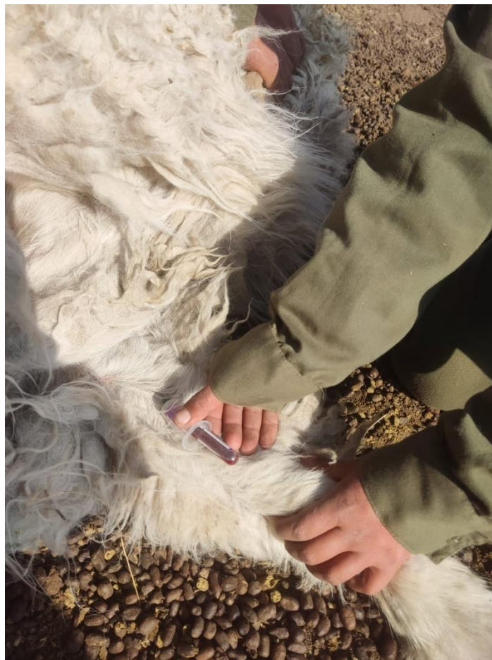
Fig. 4. Extracción de muestra sanguínea con tubo vacutainer