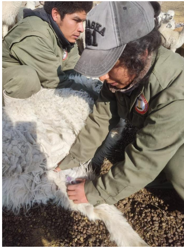
Fig. 3. Hemostasia y extracción de sangre