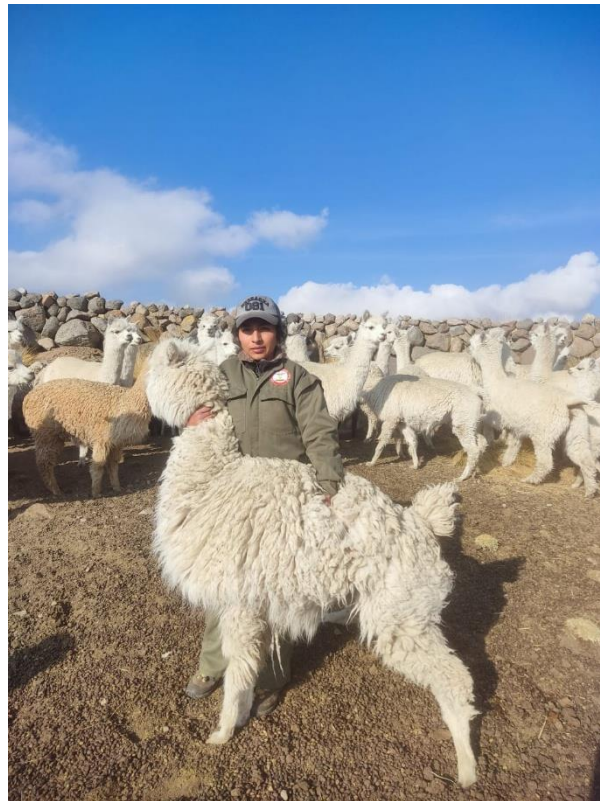
Fig. 1. Selección de alpacas ( Vicugna pacos )