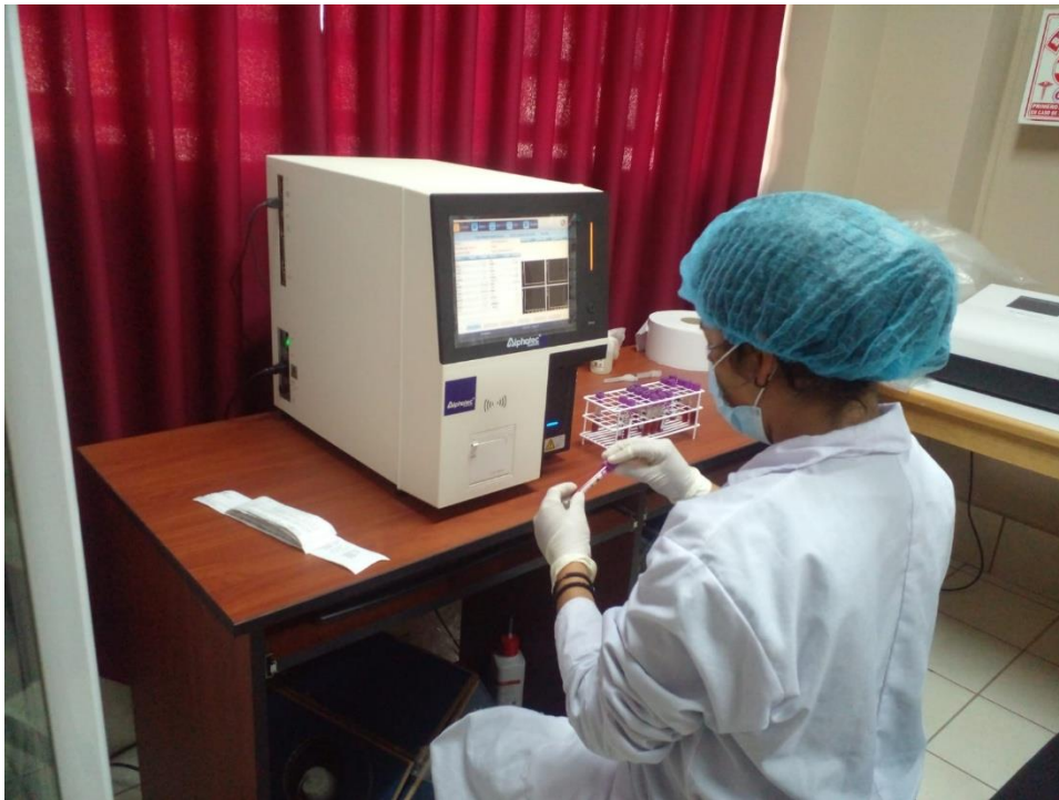
Fig. 7. Homogenizado de la muestra, antes de la lectura