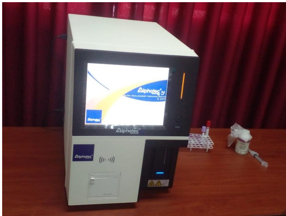
Fig. 6. Encendido del analizador hematológico veterinario