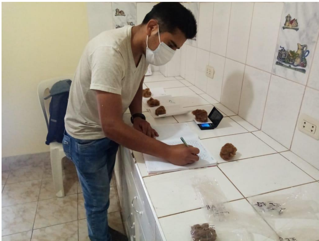
Figura 02. Pesado de fibra