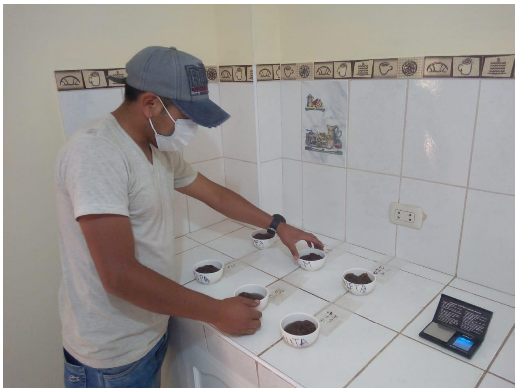
Figura 04. Lavado de fibra