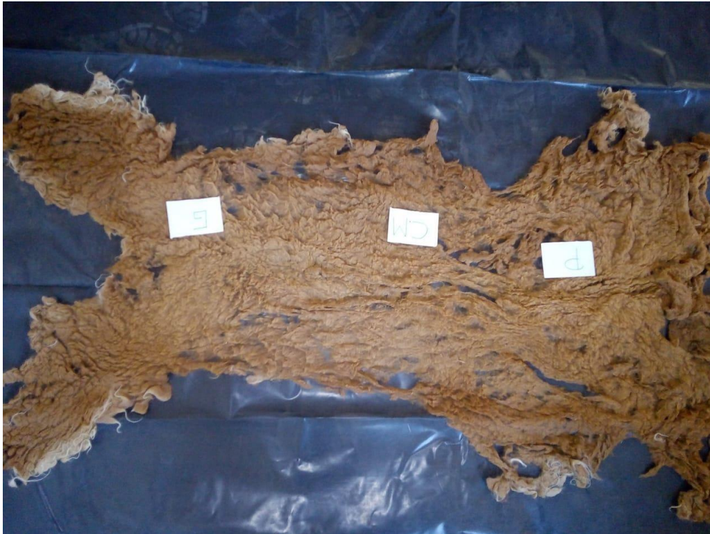
Figura 01. Selección de la zona corporal (paleta, costillar medio, grupa)