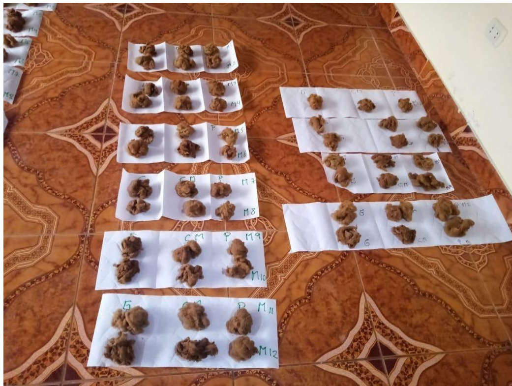
Figura 03. Muestras de fibras de cada zona corporal