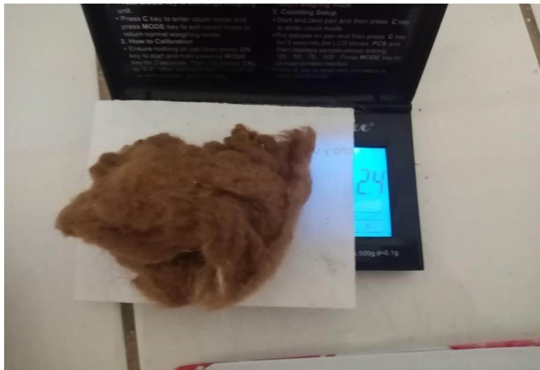
Figura 05. Pesado pos lavado de fibra