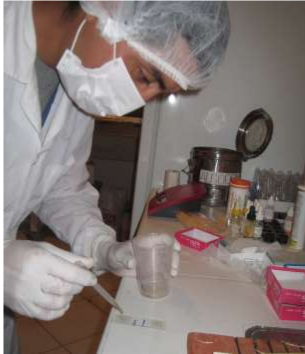
Figura 9. Transferencia de sedimento a una placa portaobjetos para su observación en el microscopio.