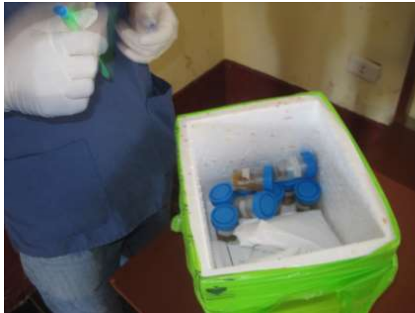
Figura 6. Recepción de muestras de heces de escolares.