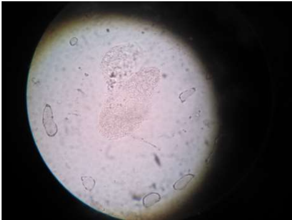
Figura 13. Huevo de Enterobius vermicularis