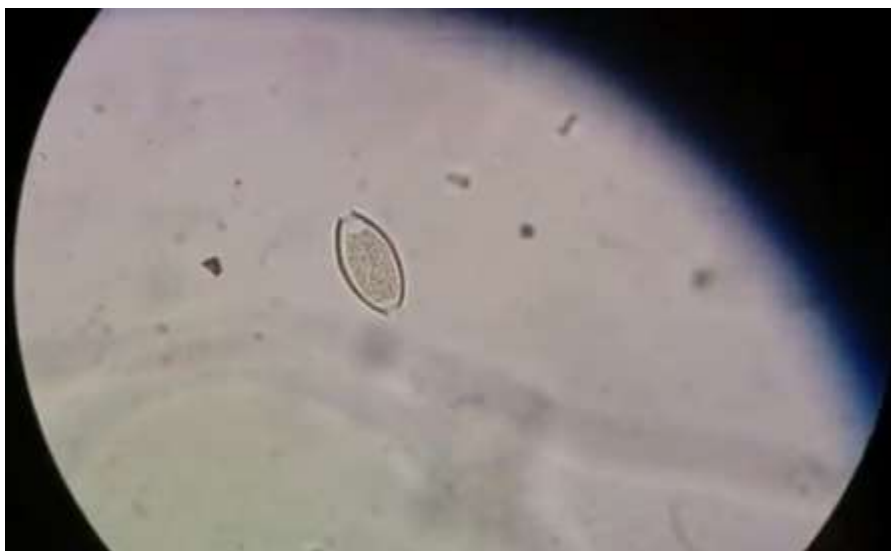
Figura 12. Huevo de Trichuris trichiura