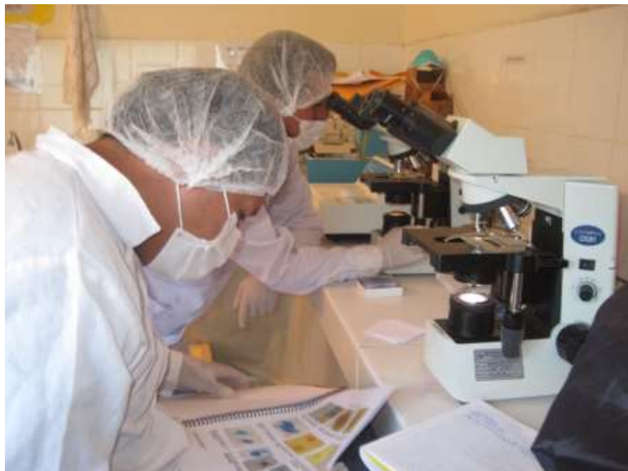
Figura 10. Identificación de enteroparásitos en el laboratorio del Centro de Salud Santa María de Chicmo.