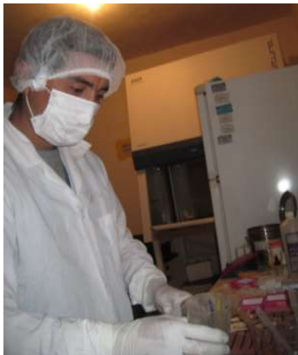
Figura 8. Homogenizado de muestras de heces para realizar la Técnica de Sedimentación Rápida.