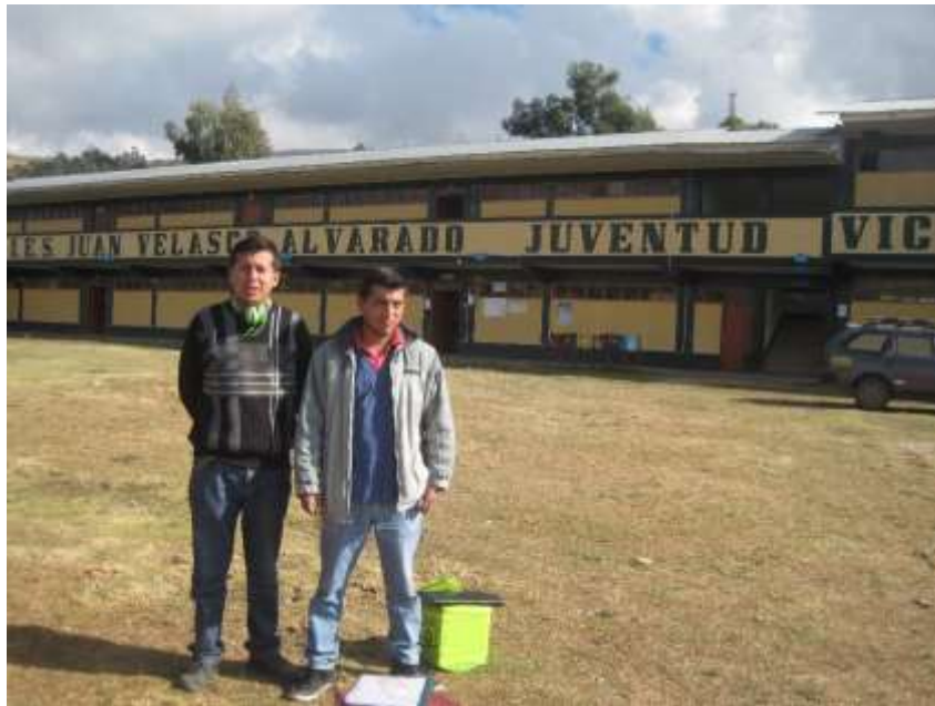
Figura 3. Coordinación con los Directores de la Instituciones Educativas a muestrear.