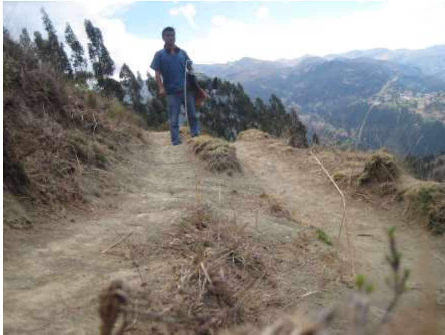
Figura 7. Visita a viviendas de los escolares.