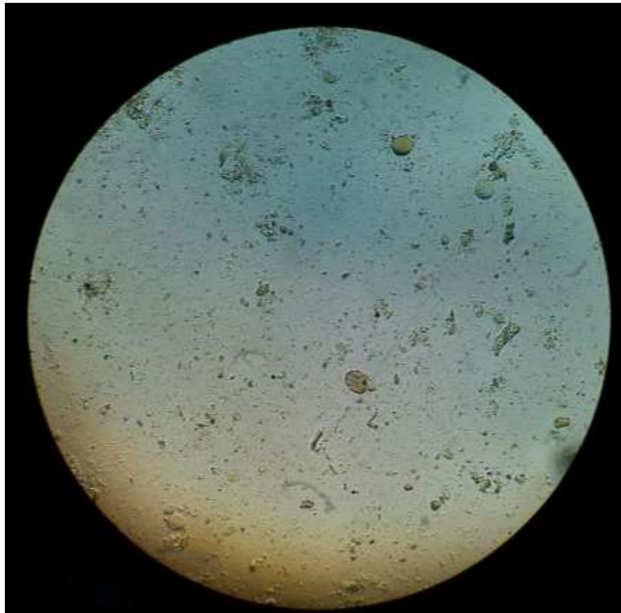
Figura 11. Huevo de Entamoeba coli