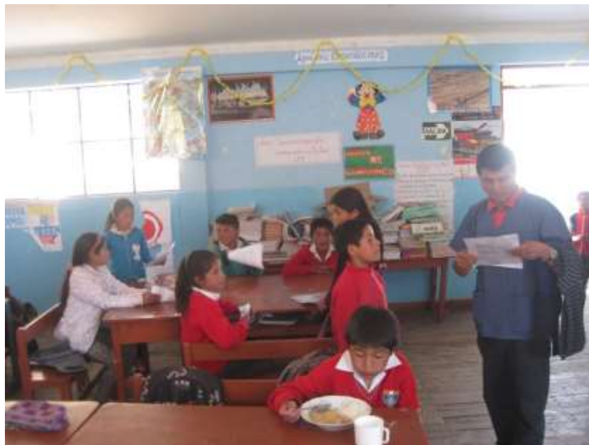
Figura 4. Sensibilización y capacitación a los escolares.