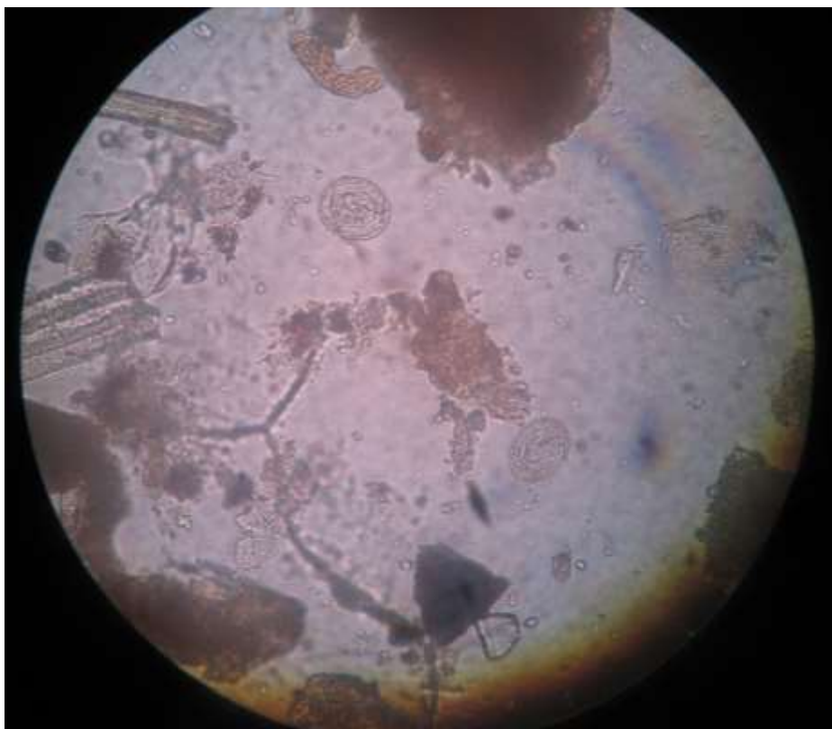
Figura 14. Huevo de Tenia sp