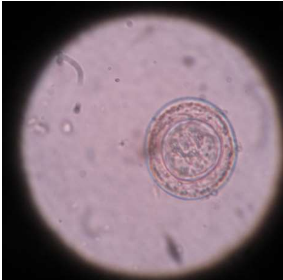
Figura 15. Huevo de Hymenolepis nana