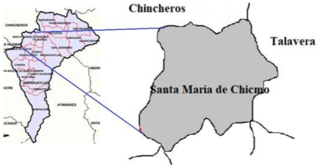
Figura 1. Mapa de la provincia de Andahuaylas y delimitación del distrito de Santa María de Chicmo.