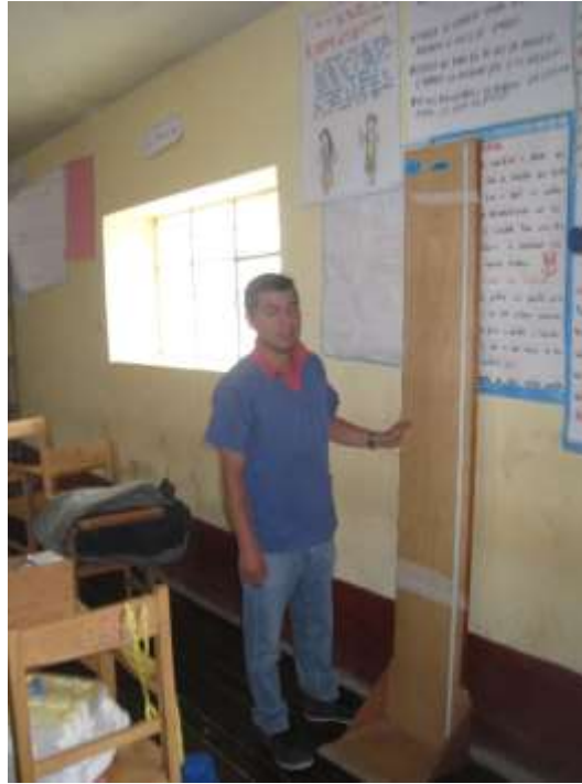
Figura 5. Tallímetro y cinta métrica, para la determinación del índice de masa corporal (IMC)