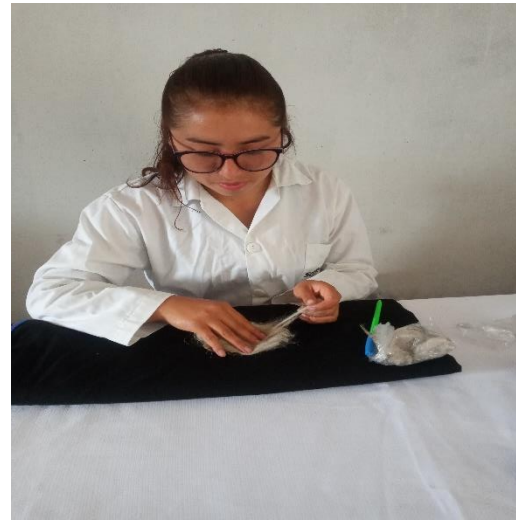
Figura 7: Descerchado de la fibra de colores blancos en un fondo oscuro