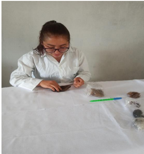
Figura 6: Descerchado de la fibra de colores oscuros en un fondo blanco