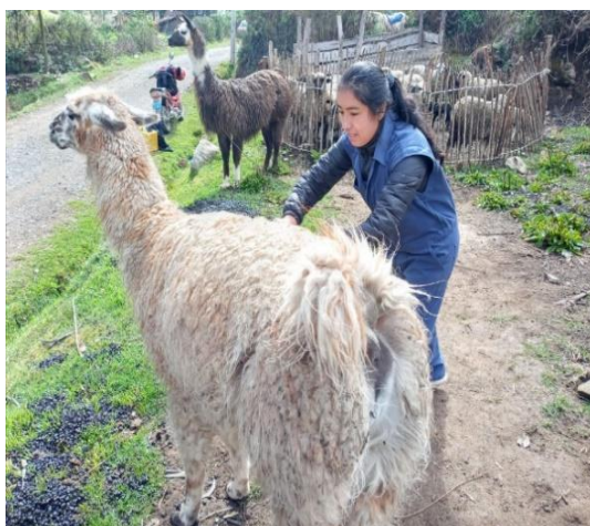
Figura 5: Toma de muestra de la región corporal de costillar medio