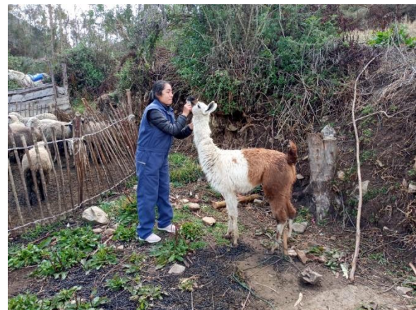
Figura 4: Determinación de la edad previa dentición