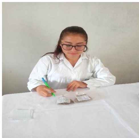
Figura 10: Terminado el rotulado de la muestra, se colocó en bolsa de polietileno.