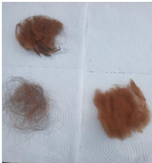
Figura 8: Resultado de la fibra descerchada