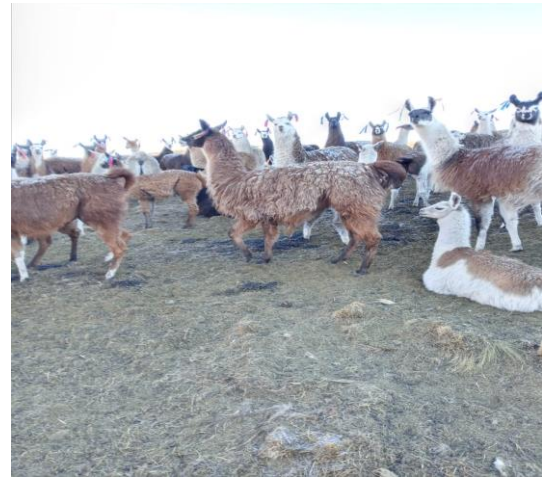
Figura 2: Selección de los animales para la toma de muestras