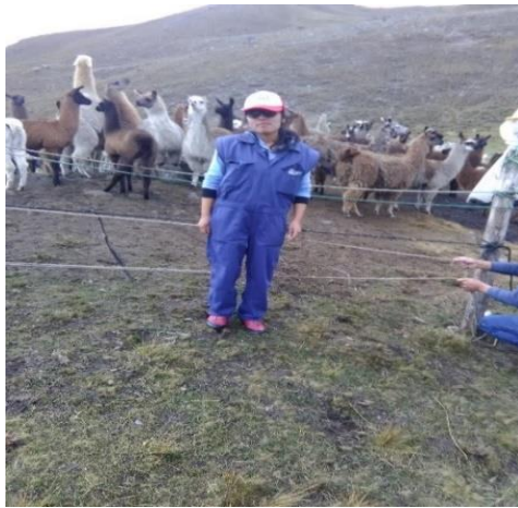
Figura 1: Selección de las llamas para la obtención de la muestra