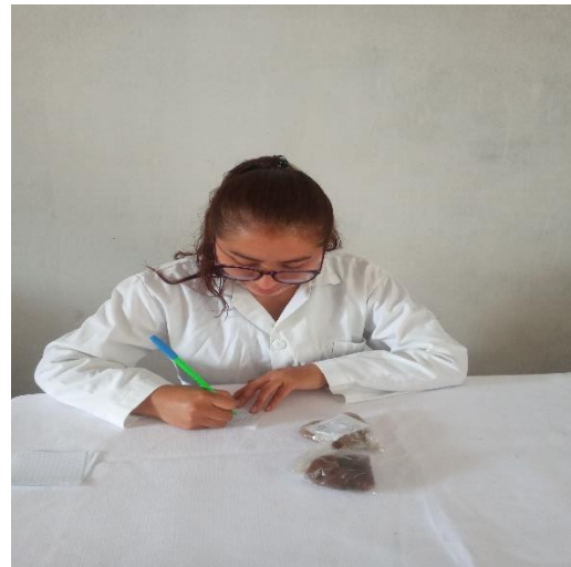
Figura 9: Rotulado de las muestras de fibra de llama, sin descerchar y descerchado utilizando el mismo código