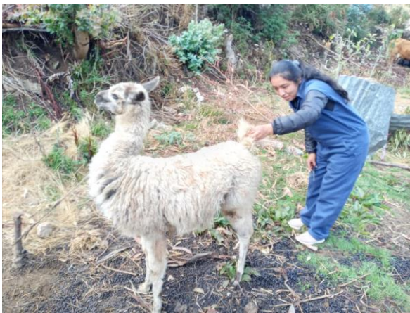
Figura 3: Determinación del Sexo